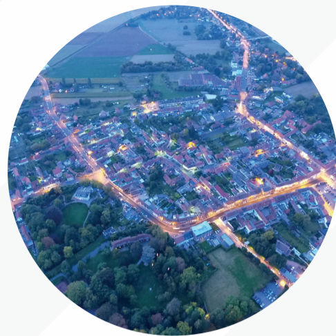
Alorem ipsum dolor