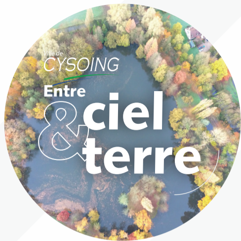
Alorem ipsum dolor