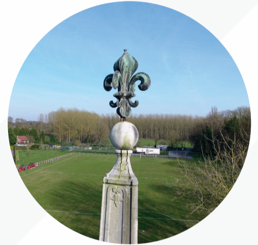
Alorem ipsum dolor