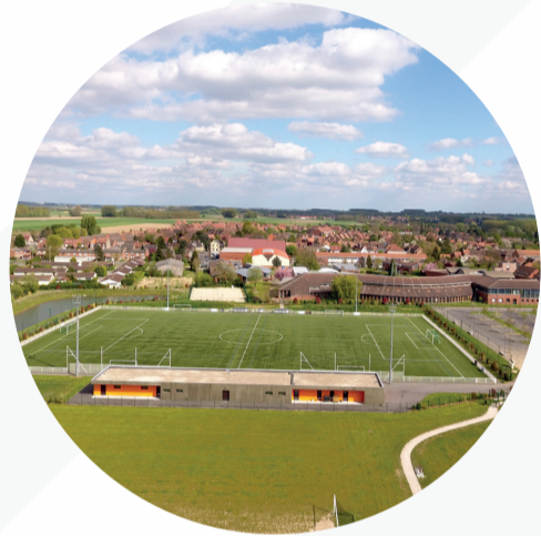
Alorem ipsum dolor