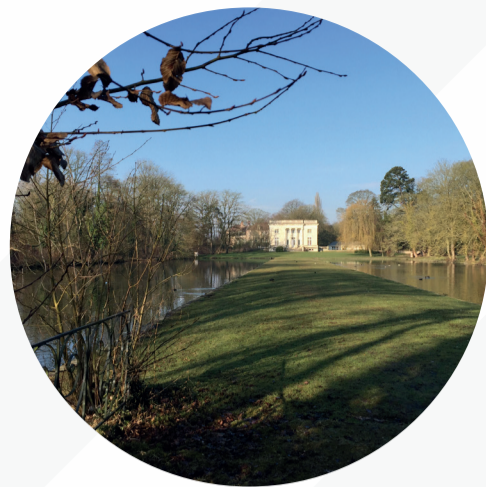
Alorem ipsum dolor