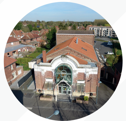
Alorem ipsum dolor