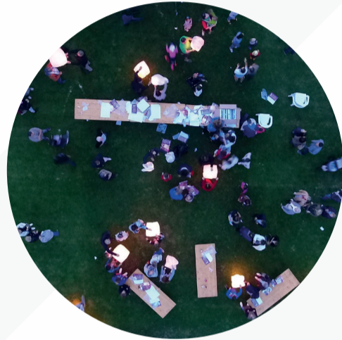
Alorem ipsum dolor