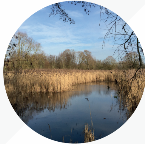
Alorem ipsum dolor