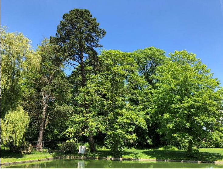
Arbres remarquables du parc du château