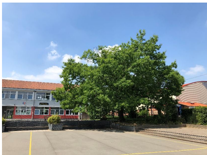
Chêne d'Amérique - école YAB