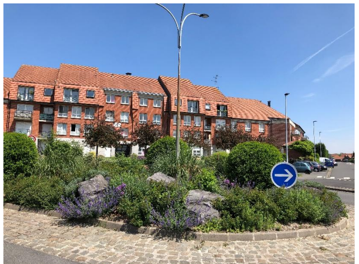
Plantation de vivaces et tapissantes