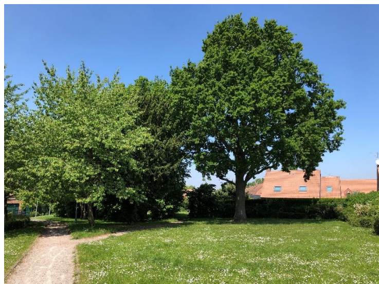
Chêne remarquable du parc des Voyettes