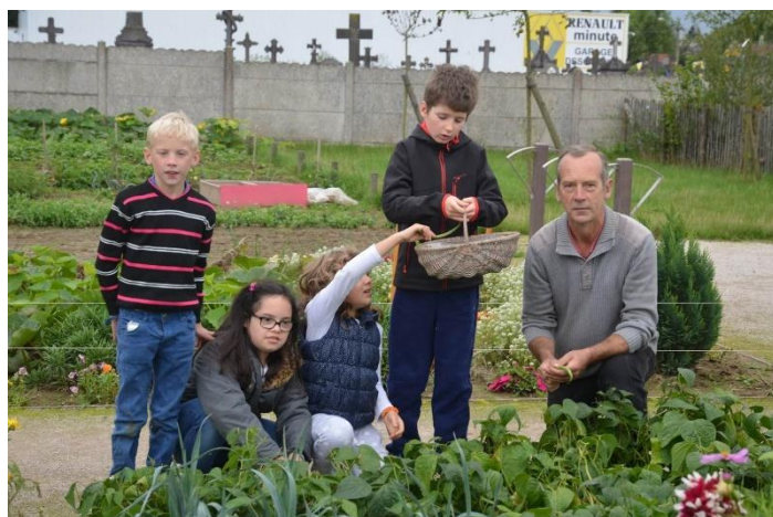
Jardin écologique de l'école