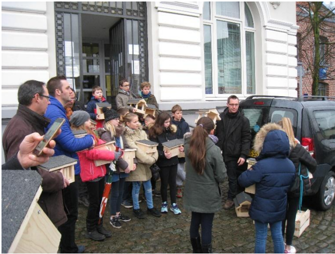
Pose de niohirs et mangeoires