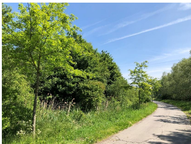
Chêne des marais – chemin des caches vaches