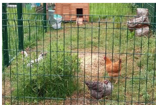
Poulailler de l'école