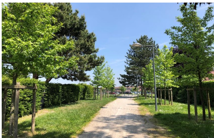
Liquidambars près du stade