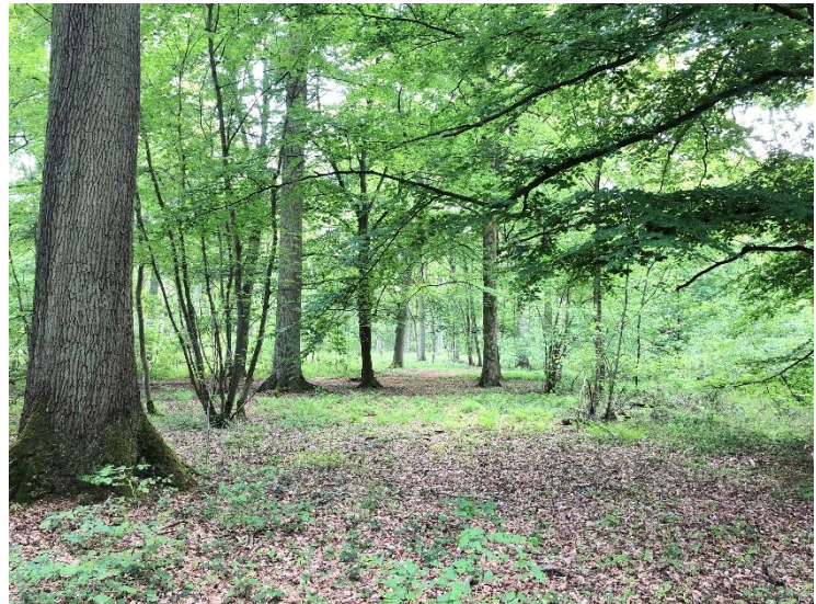
Bois de la Tassonnière