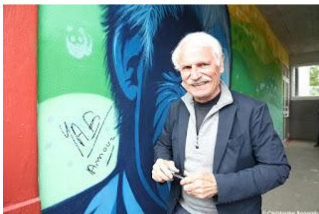
Yann Arthus-Bertrand signe sa fresque