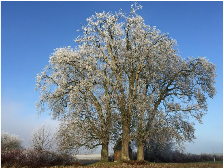
La chapelle aux arbres