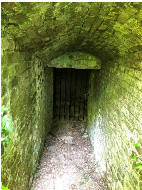
Glacière transformée en niohir à chauve-souris